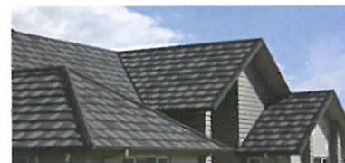
杉板の風合いを再現した シェイク