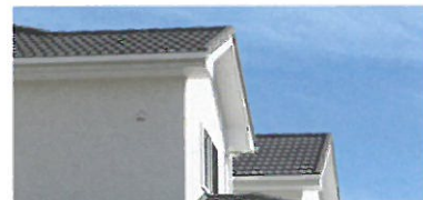
瓦の立体感を継承した クラシック