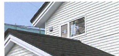
立体的にデザインした モダン